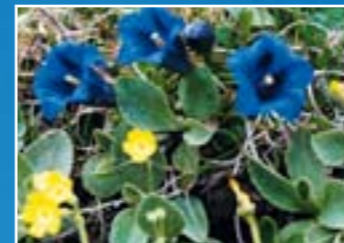
山のフラワートレイル