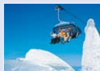
スキーリフト「アイス・フライヤー」

2. 氷河洞窟。氷河の中心まで進んで、不思議な光と音に囲まれた氷河の世界を体感します。