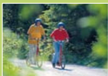
トロツティ・バイク

1. みどころ トロツティ・バイク。 この楽しい二輪車に乗って、お好みの速さでゲルシュニアルプとエンゲルスベルクの間を駆け抜けます。ゲルシュニアルプ駅でお申し込みください。