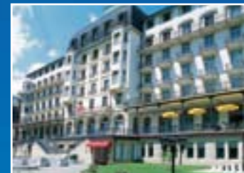
エンゲルベルクのホテルのテラス