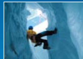
クレバスでのアプセILING（懸垂下降）