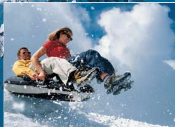
グレイシャー・パーク