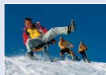
グレイシャー・パークでのスノーシュー

4. みどころ ティトリス・グレイシャー・パーク。タイヤのような形をしたスノーチューブで特別な滑走コースを滑ったり、 balan