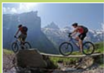
マウンテンバイク

ハイキング / マウンテンバイク。ハイキングまたはマウンテンバイクをお選びください。トリュブゼからエングストレンアルプ、タンネンゼー、メルヒゼー、フルットまでの途上では4つの湖を眺めることができます。